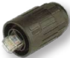
RJ45 Plug 防水插頭 型號：RJ45F6